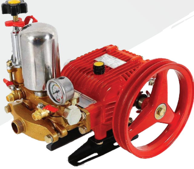
ಮಾಡೆಲ್: ಶ್ರಾಚಿ ಎಸ್‌ಆರ್-ಎಚ್‌ಟಿಪಿ-22