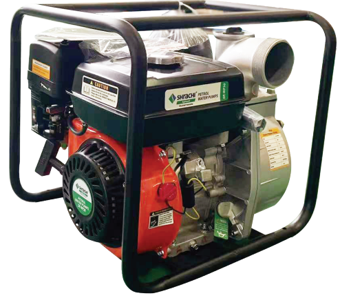
ಮಾಡೆಲ್: ಶ್ರಾಚಿ ಡಬ್ಲ್ಯು ಪಿ-30