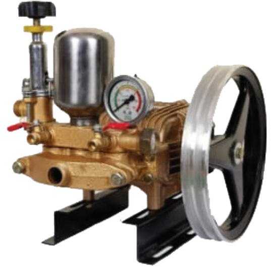
ಮಾಡೆಲ್: ಶ್ರಾಚಿ ಎಸ್‌ಆರ್-ಎಚ್‌ಟಿಪಿ-30