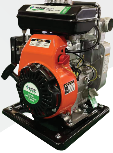
ಮಾಡೆಲ್: ಶ್ರಾಚಿ ಡಬ್ಲ್ಯು ಪಿ-15